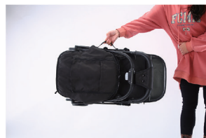
4. Допускается использование боковой ручки для переноса